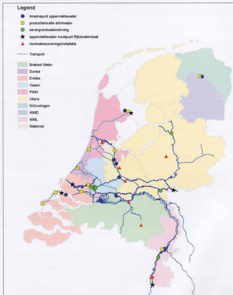
Afb. 1: Overzicht van de meetlocaties.